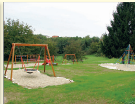
»Pod svobodnim soncem« - park igral za Domom kulture