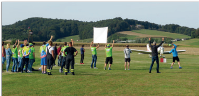
Iz varne razdalje so državno prvenstvo spremljali številni domačini in ljubitelji letalstva, ki so tudi bučno navijali.

Organizator je vzorno poskrbel za zaščitno opremo in vse drugo za zaščito pred širjenjem bolezni covid-19, vse udeležence na prvenstvu pa so pisno evidentirali.