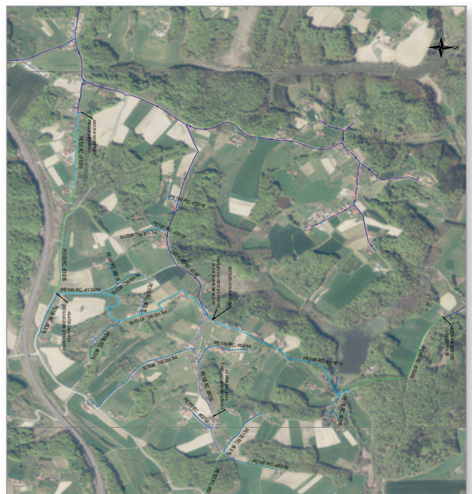
Idejna projektna zasnova novega vodovoda

V prvi fazi se bo tako izvedla navezava javnega vodovodnega sistema na obstoječe omrežje, ki pa bo v prihodnje v celoti obnovljeno. Za ta namen sta obe občini skupaj naročili izdelavo potrebne projektne dokumentacije, ki je predhodno nujno potrebna za načrtovanje in izvedbo del.