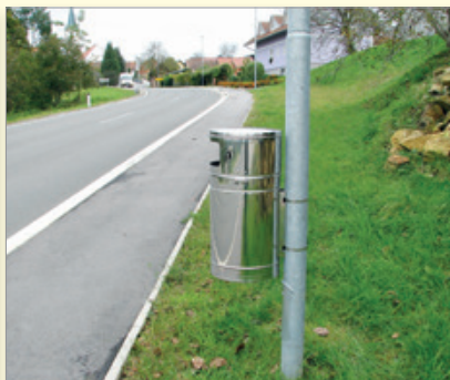
Novi koši za smeti na vpadnicah v občinski center