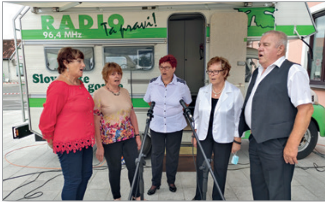
Pevci Društva upokojencev Cerkvenjak