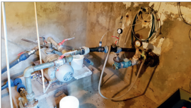
Dotrajano črpališče Osojnica

V letu 1975 izgrajeno osnovno vodovodno omrežje za predmetni naselji je bilo leta 1993 zaradi pomanjkanja vode, izključno na stroške obeh občin (takratnih občin Lenart in Gornja Radgona), dograjeno v dolžini ca. 2.100 m z navezavo na vodni vir "Osojnica", ki pa mu veljavno vodno dovoljenje poteče dne 31. 12. 2020 in brez katerega po tem datumu ne bo mogoče legalno oskrbovati predmetnega območja s pitno vodo, v kar pa nobena od občin ne more in tudi ne bo pristala.