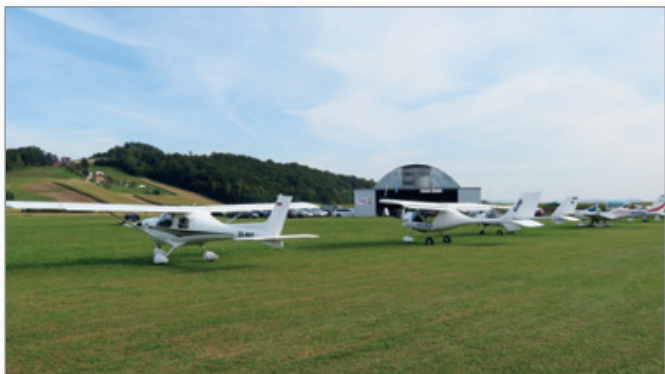
Državnega prvenstva v letenju z motornimi zmajmi in ultralahkimi letali na vzletišču Cerkevjak v Čagoni se je udeležilo 11 ekip iz vse Slovenije.