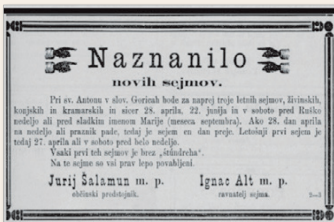
Slovenski gospodar je 21. 2. 1878 napovedal tri sejme pri Sv. Antonu v Slovenskih goricah.