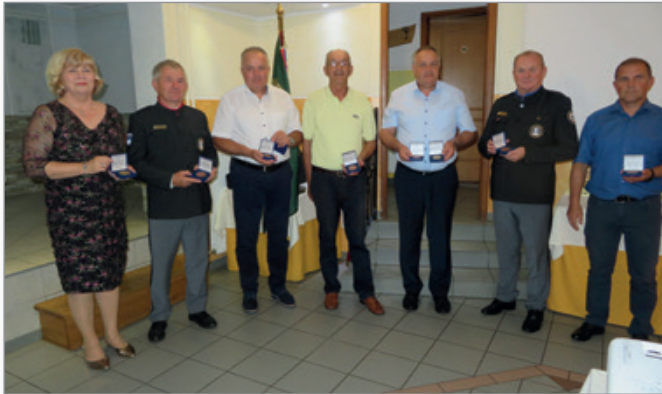
Ob jubileju Društva general Maister Cerkevjak so najbolj zaslužnim članom in podpornikom podelili spominske plakete.