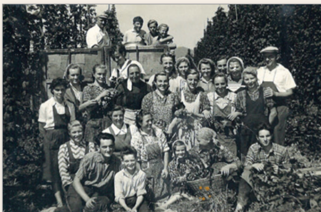
Skupina obiralk in obiralcev hmelja iz Cerkvenjaka leta 1962 v Orla vasi.

Čas okoli Marijinega praznika (15. avgust) je včasih pomnil opozorilo za iztekajoče se poletne počitnice, v Savinjski dolini pa je bil znak za začetek obiranja hmelja.