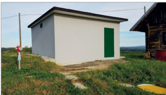
Vodohran Ivanjski Vrh po prevezavi na javni vodovod ne bo več v funkciji.

Že vsaj 20 let se s strani Občine Cerkevjenjak imenovano odgovorno osebo za SHP in HACCP v sodelovanju z vaškim vodovodnim odborom zagotavlja zdravstvena ustreznost pitne vode in se tako izvaja gospodarska javna služba oskrbe s pitno vodo.