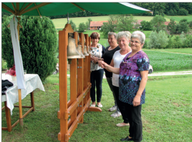
Obred so popestrili cerkveni pevci in pritrkovalke.

Praznik srca Jezusovega obhaja cerkev osem dni po prazniku Svetega Rešnjega telesa in Rešnje krvi. Letos je bil to 19. junij. Dan pozneje pa cerkev obhaja tudi praznik srca Marijinega. Zgodovina čaščenja Jezusovega Srca se začne z apostolom Janezom, ki se je naslonil na Jezusove prsi, in apostola Pavla, ki je svoje vernike imel rad v ljubezni Jezusa Kristusa. Čaščenje Jezusovega srca so širili srednjeveški mistiki, posebno sveti Bernard, sveti Bonaventura in sveti Bernardin. Ob stoletnici, odkar je bil praznik srca Jezusovega razširjen na vso katoliško cerkev, je PIJ XII. leta 1956 izdal okrožnico Haurietis aquas, v kateri je podal vsestransko in globoko teologijo srca Jezusovega. Pavel VI. pa je leta 1965 napisal okrožnico Nedoumljivo bogastvo Kristusovo. V njej je znova naglasil pomembnost Srca Jezusovega. V duhu drugega vatiškanskega koncila je močno poudaril zvezo, ki jo ima to čaščenje z evharistijo, posebej z njenim daritvenim značajem, se pravi z mašo in obhajilom kot daritvenim obredom. Že leta 1899