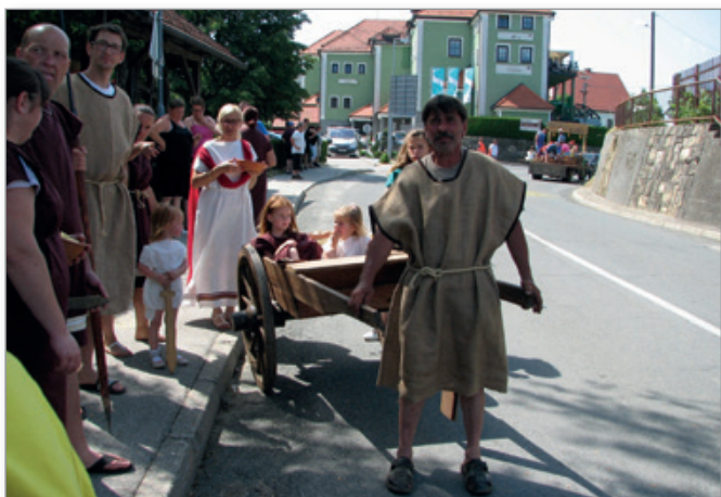
Takšnih in podobnih prizorov pa letos ob praznovanju občinskega praznika nismo videli, saj je praznovanje zaradi korone bilo okrnjeno.

Čeprav letos osrednje proslave ni bilo in je bila le slavnostna seja občinskega sveta s podelitvijo občinskih priznanj, so praznični dogodek poleg Slovenskogoriškega pihalnega orkestra MOL iz Lenarta popestrili tudi praporščaki cerkvenjaških društev in organizacij.