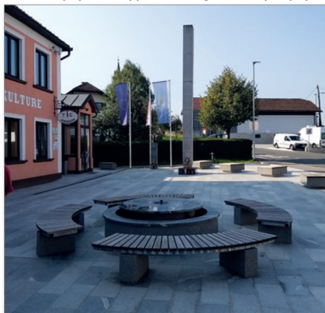
Sredi letošnjega septembra poškodovana fontana ni delovala

Tudi danes znajo mladi ušpičiti marsikakšno neumnost, ki bo obogatila zakladnico šaljivih zgodb. Vendar pa je pri tem pomembno, da ne povzročajo škode. Tako včasih kot danes ni bilo in ni smešno, če kdorkoli drugemu ali drugim namerno povzroča škodo in ga oziroma jih na ta način trajno oškoduje. Dejanja, s katerimi njihovi akterji namerno povzročajo drugim ali skupnosti škodo, ne sodijo med šaljive norčije, temveč jih imenujemo vandalizem. Vandalizem pa ni izraz razigranosti in navihanosti, temveč kaže na objestnost, napuh in večvrednostni kompleks storilcev. Zato vandalska dejanja ne najdejo svojega mesta v zakladnici šaljivih zgodb, temveč v policijskih kartotekah in črni kroniki. Vandali, ki se trudijo ostati anonimni, pa niso neustrašni junaki, temveč strahopetni povzročitelji kaznivih dejanj, ki se bojijo razkriti in priznati svoja dejanja.