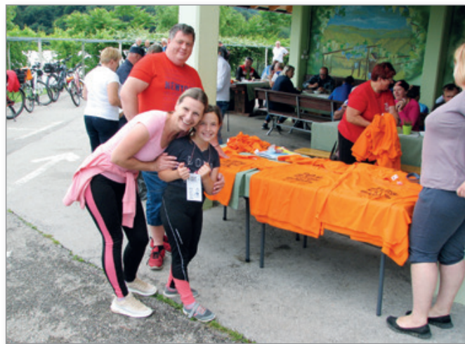
Vsi udeleženci, ki so prevozili kolesarsko progo, so bili deležni malice in spominske majice.