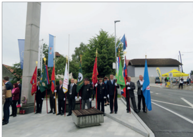
Tako kot vsako leto so tudi ob letošnjem občinskem prazniku pripravili zbor praporov društev in organizacij iz Cerkevjaka.