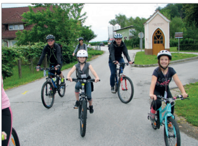
Kolesarska proga prireditve S kolesom po mejah Občine Cerkevjak vsa leta poteka delno tudi po sosednji Občini Sv. Andraž, kjer je nastala ta fotografija.

25. junij – dan državnosti je v Cerkevjaku, kjer meseca junija praznujemo svoj občinski praznik, rezerviran za ljubitelje kolesarjenja. Tako je bilo tudi letos, ko je prireditev, ki spada v okvir dogajanj ob občinskem prazniku Občine Cerkevjak,