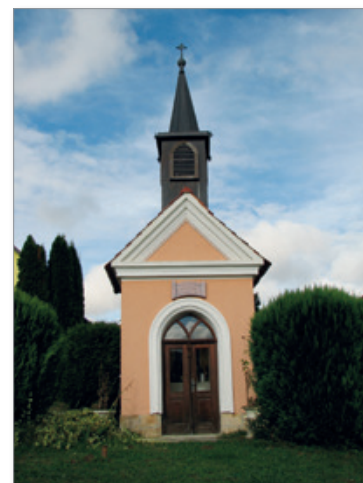
Sklepati gre, da je bila kapelica, ki je posvečena Srcu Jezusovemu, postavljena v duhu napovedi papeža Leona XIII., ki je ob koncu devetnajstega stoletja napovedal, da bo za začetek dvajsetega stoletja ves svet posvetil Srcu Jezusovemu.