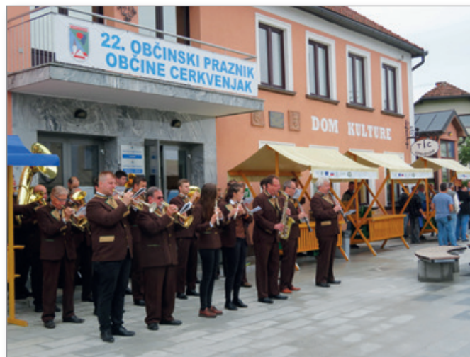
Tako kot vsako leto tudi na 22. občinskem prazniku Občine Cerkevjak ni šlo brez orkestra KD MOL Lenart.