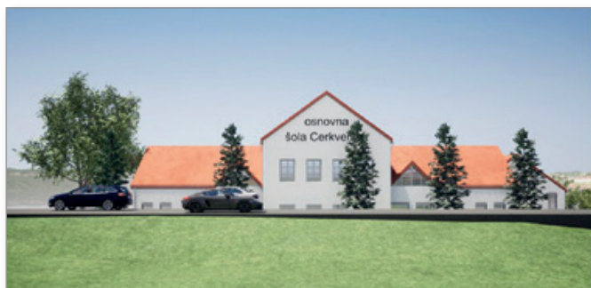
Novi in modernejši izgled pročelja objekta OŠ Cerkevjak

Vsekakor pa je objekt, katerega neto tlorisna površina znaša 2.500 m 2 in površine fasade ca. 3.000 m 2 , velik potrošnik tako toplotne kot električne energije, kar pa je možno zmanjšati samo z obnovo objekta, in sicer v prvi fazi z energetske sanacije.