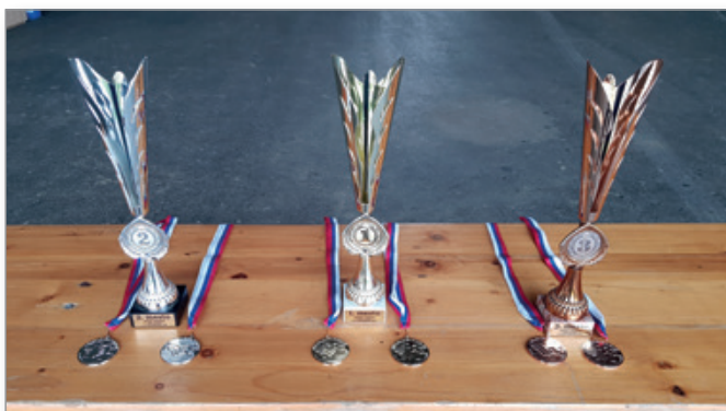
DP ULN 2020 Cerkevjak

Cilj kluba v prihodnje je predvsem zagotavljati najboljše možne pogoje za varno letenje tako za motorne pilote, modelarje kot motorne padalce. Prav tako želimo še naprej aktivno sodelovati z domačimi in tujimi klubi ter delati na približevanju letalskega športa vsem zainteresiranim. Zato vse zainteresirane vabimo, da se nam pridružite v klubu ali vsaj na naših prireditvah.