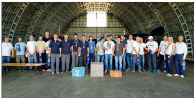
Dobitniki medalj in drugi udeleženci so pohvalili odlično organizacijo državnega prvenstva.

Prvenstvo, ki je potekalo v čudovitem jesenskem vremenu, je bilo zaradi covid-19 zaprtega tipa in gledalci niso imeli pristopa. Kljub temu pa so si tekmovalni del prvenstva številni ogledali iz varne razdalje ter uživali v izkazani spretnosti letalcev. Tekmovalce domačega letalskega kluba Sršen je od daleč bodrila celo številčna navijaška skupina, oborožena s transparenti in drugimi navijaškimi rekviziti.