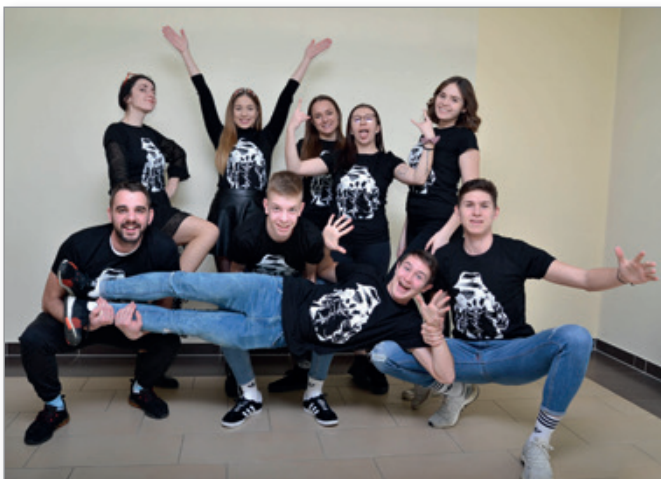
Upravni odbor ŠKSG

Vabljeni tudi vsi vi, da v novem šolskem ali študijskem letu 2020/21 razturate z nami. Včlanite se v klub ŠKSG na enih izmed uradnih ur (sreda 17:00 – 20:00, sobota 10:00 – 13:00), ali pa izpolnite prijavo na naši spletni strani (sksg.org). Več informacij lahko najdete tudi na našem Facebook in Instagram profilu, ali pa nam pišete na e-poštni naslov (info@sksg.org). Radi vas imamo in se že veselimo sodelovanja z vami, vaš ŠKSG!