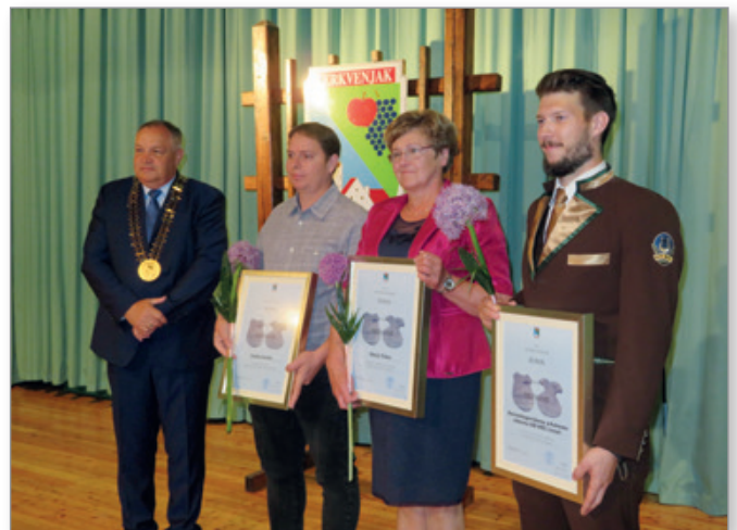
Dobitniki županovih priznanj

Na razširjeni slavnostni seji Občinskega sveta Občine Cerkevjak so podelili tudi priznanja in nagrade najbolj zaslužnim posameznikom in organizacijam. Srebrni grb občine je prejel Nogometni klub Cerkevjak, ki je lani praznoval 20 let delovanja. Klub ima že od ustanovitve več selekcij, od U7 do članov, letos pa so ustanovili še ekipo Nogometnega vrta NK Cerkevjak. Nogometaši igrajo v Medobčinski nogometni zvezi Maribor. Klub, ki je v minulih dvajsetih letih dosegel številne uspehe na športnem področju, ima med vsemi športnimi društvi v občini največ članov. Bronasti grb Občine Cerkevjak so prejeli Ljudski pevci Društva upokojencev Cerkev-