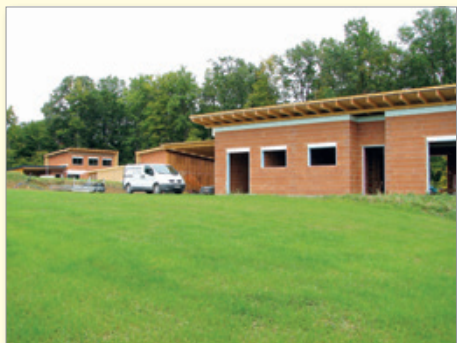
V Cogetincih raste novo naselje.